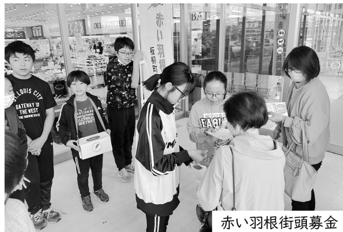
赤い羽根街頭募金

5・6年生は、認知症サポーター養成講座や赤い羽根共同募金の街頭募金を行いました。街頭募金では元気な声で募金を呼びかけてくれたおかげで、約1万7624円の募金が集まりました。